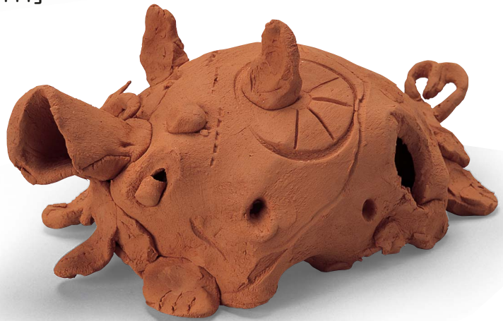
■ [す焼き／高さ 9cm]