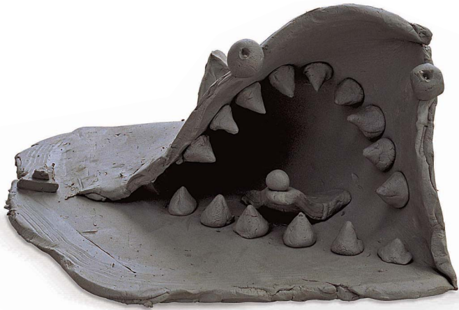
■ [土ねん土／高さ 17cm]