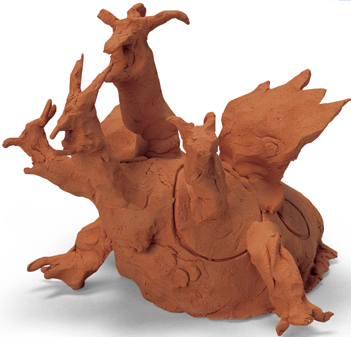
■ [す焼き／高さ 14cm]