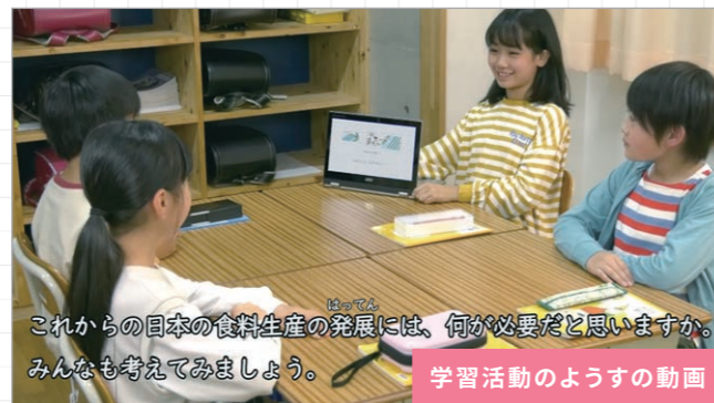
学習活動のようすの動画