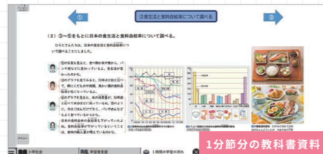
1分節分の教科書資料