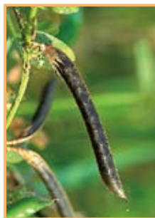
写真5 成熟した果実です。