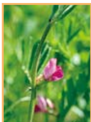
写真1 春の日差しを受けて咲くカラスノエンドウ。

春、道ばたなどに生えている身近な野草です(写真1)。漢字では、「烏野豌豆」と書きます。花が咲く期間は短くて、周りの草の背丈が高くなる前に結実し、種子をはじき飛ばします。子どもの頃、果実(豆莢)で笛をつくって遊んだ方も多くことでしょう。