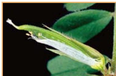
写真3 花が散ってすぐ、がくを半分に切ってみました。幼い果実が成長しています。