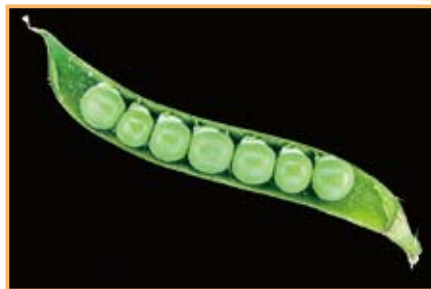
写真4 大きく成長した果実。半分に切ってみると種子が七つできていました。