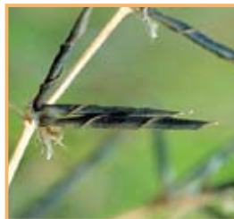
写真6 果実の皮が乾燥するとクルクルとめくれます。その時、種子をはじき飛ばします。

小林先生への質問、ご感想、先生の写真を授業で使いたい！ などなど、お待ちしております。