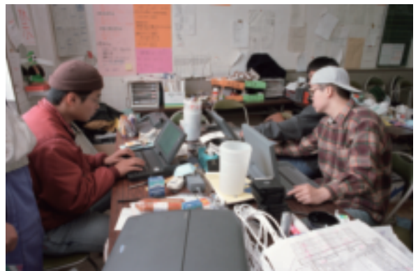
▲パソコンを使い、情報を入手するボランティア