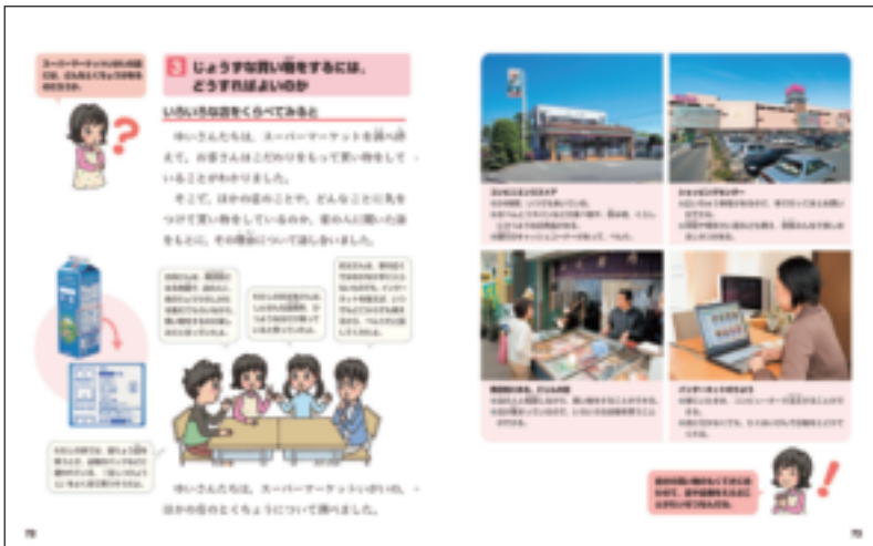
▲ 3・4年上 P.72～73