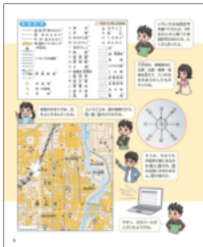
▲3・4年下P.3 (上), P.4 (下)

また、普通は見開き2ページの設定ですが、本单元は問題と解答のページが表裏の関係になっています。ですから、まずは自分たちでやってみて、次のページをめくると確かめられたり、困ったときには次のページをめくるとする方法を選ぶことができます。そして、教科書に取り上げられている地図のデータが指導書の付属DVDに収録されていますから、黒板に掲示して子どもたちと一緒に学習を進めていくことができます。