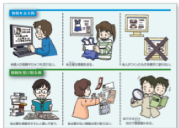
▲ 5年下P.68 図