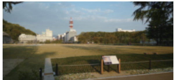
堀之内より見た市内中心部

建設されていたが、松山城の史跡内であることから、これらの施設は一部を残して撤去され、広大な都市公園が出現することとなった。