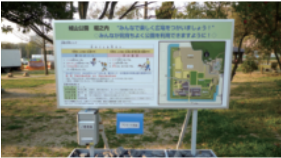
アンケートの呼びかけと回収箱