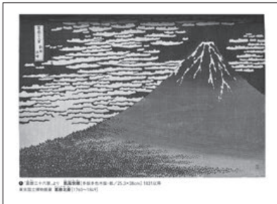
▲2・3上 P.2～4 オリエンテーション