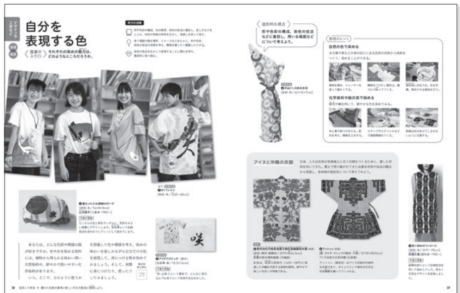
▶2・3下 P.38～39 自分を表現する色

1年生で育ててきた造形的な視点（造形的な見方・考え方）に、思春期の生徒ならではののみずみずしい感性、新たな知識を加えて主体的に創作活動に取り組むことで、想像以上の能力が発揮されることがあります。伝統文化を学び、現代との共通点や違いを考え、自分ならではの表現に取り組む題材も設定しています。