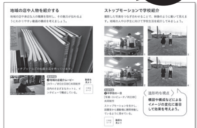
▲2・3下 P.42～43 動きで伝えるメッセージ