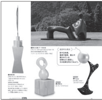
▲2・3下 P.20～21 あなたのイメージを探そう