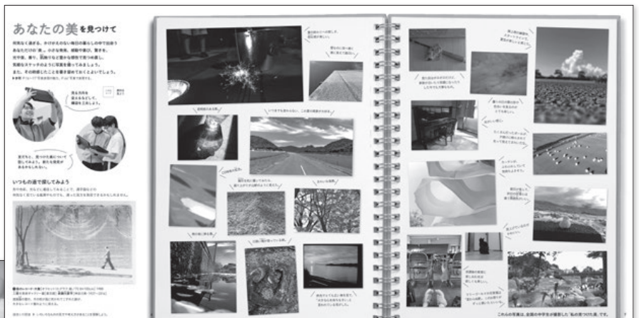
▲2・3上 P.6~7 あなたの美を見つける 全国の中学生が撮影した「私の見つけた美」

美術2・3上では、美術の学びを通して美しさを実感し、感動、発見を素直に表現できる巻頭ページを。美術2・3下では、美術の学びで得た力を社会に向けて発信することの意義を、自分のこととして深められる巻頭ページを設定しました。