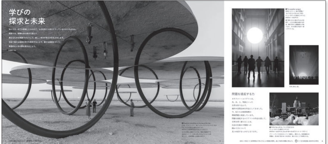
▶2・3下 P.2~4 オリエンテーション

美術2・3上では、表現活動に試行錯誤しながら「見る」「感じ取る」「考える」ことを基本に、美術2・3下では、新しい見方・感じ方で新たな価値をつくり、創造的な人生の扉を開く作品との出会いを大切にしています。