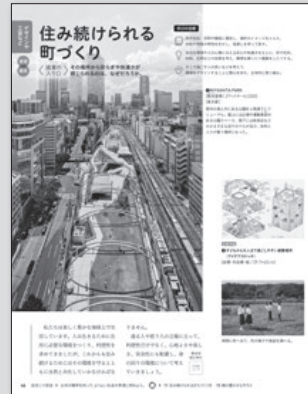
◀2・3下 P.46~47 住み続けられる町づくり

社会が抱える大きな課題を、自分たちの身近な課題に置き換え、プロセスを踏まえて改善方法を考えるなど、美術と社会との関係を実感しながら学びます。