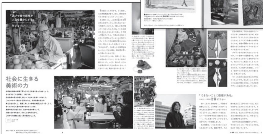
◀2・3下 P.5~7 社会に生きる美術の力 自分自身の見方や考え方を大切にする3名を取り上げました。