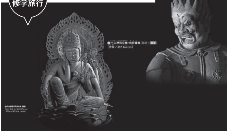
▲2・3下 P.32～33 仏像の姿に見る人々の祈り