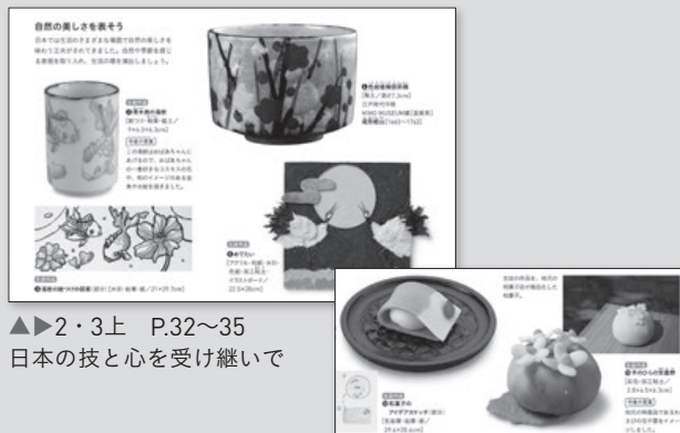
▶2・3上 P.32~35 日本の技と心を受け継いで

日本の広い地域では、昔から四季の色彩を取り入れた造形があります。また、世界には色彩に特徴をもった工芸品があります。これらを学ぶことで、四季を楽しむ表現や生活を豊かにする色彩について興味を促します。