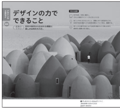
▲2・3上 P.48～49 デザインの力でできること