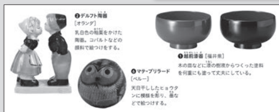
▶2・3下 P.59 世界の工芸品と色彩