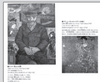
◀2・3上 P.30~31 日本文化との出会い

19世紀後半に西洋で起こったジャポニスム（日本趣味）は、日本の開国、日本と西洋との交流と深いつながりがあります。美術で学ぶ歴史的な事項、表現テーマの設定や表し方は他の教科と関連する内容が豊富に詰まっています。