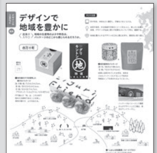
▶2・3下 P.44~45 デザインで地域を豊かに