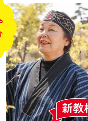
▲1年 p.106 「21 あらゆるものに神は宿っている」

アイヌ民族の文化や考え方を新たに切り上げるなど、国内外の文化的多様性に触れる教材・コラムを掲載しています。