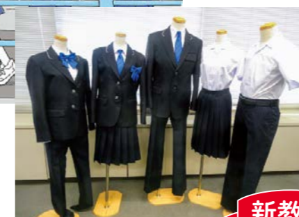
▲2年 p.120 「24 制服は誰のもの」

表紙や挿絵にはスラックス着用 of 生徒を描き、制服における多様性への配慮に触れる教材も開発しました。