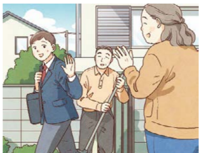
▲3年 p.132 「24 町内会デビュー」

地域の 人 とつな が り、 支 え合 う ことに目 を 向 け られる教材や、 地 域の 文 化な ど について扱 っ た コ ラムを複数掲 載 しています。