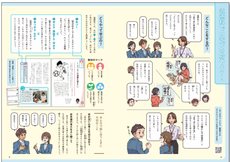
▲1年 p.4 「道徳科での学びを始めよう！」

1年生のオリエンテーションページには学校の道徳科でどんなことを考えるのか漫画で示し、学習をスムーズにスタートできるようにしました。