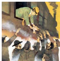
▲3年 p.44 「7 命のトランジットピザ」

小学校の道徳科でよく学ぶ題材を別の視点で取り上げ、 系統的・発展的に学習 できるようにしました。