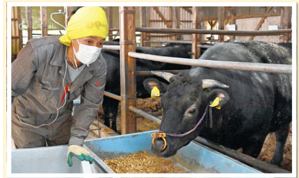
③ 松阪牛の飼育(2016年 三重県松阪市)