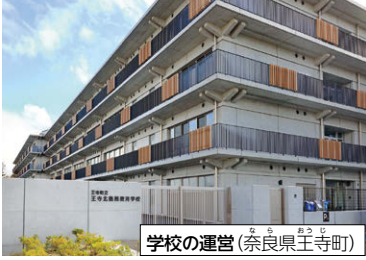
⑩ 窓口業務 (兵庫県加古川市) ⑪ 学校の運営 (奈良県王寺町)