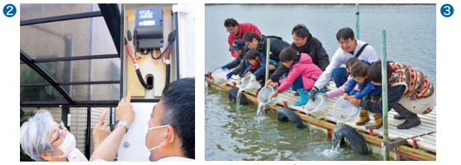
② AIによる高齢者の健康の見守り (2022年、三重県東員町) 各戸の電力計の消費電力量のデータをAIが分析して、高齢者の健康状態を判定します。 ③ 淡水魚の稚魚の放流 (2019年、滋賀県近江八幡市) 琵琶湖の生態系保全のため、琵琶湖固有のニゴロブナなどの稚魚を放流しています。