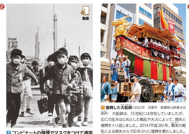
⑦ コンビナートの煤煙でマスクをつけて通学する子ども(1965年 三重県四日市市) 市と県・企業とが対策に取り組み、1976年度には、ぜんそくの主な原因とされる物質の濃度が国の基準をみとすことが確認されました。