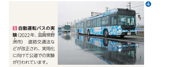
④ 自動運転バスの実験 (2022年、滋賀県野洲市) 道路交通法などが改正され、実用化に向けて公道での実験が行われています。