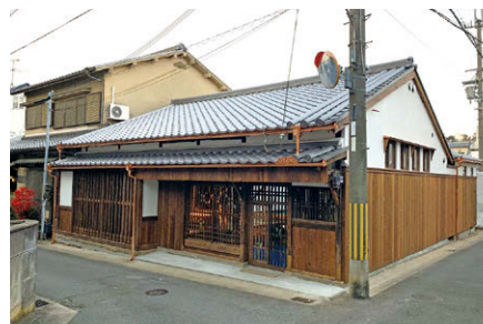
2 奈良市が修理費の一部を補助した町家 (2019年 奈良県奈良市)