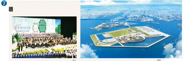
⑦ 2005年の愛・地球博「自然の歓び」をテーマに、地球環境問題の解決など、世界の国が協力して、未来の社会の創造に向けて開催されました。 ⑧ 2025年の大阪・関西万博(予定)「いのち輝く未来社会のデザイン」をテーマに、人々の健康と持続可能な社会をつくるという人類共通の課題解決に取り組みます。 ⑨ 社会の変化