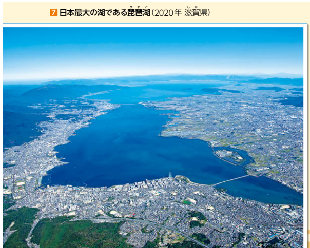
④ 日本最大の湖である琵琶湖(2020年 滋賀県)