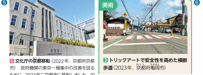
⑥ 文化庁の京都移転 (2022年、京都府京都市) 政府機関の東京一極集中の改善を図るために、2023年に京都市に移転しました。中央省庁の地方移転は明治以来初めてです。 ③ トリックアートで安全性を高めた横断歩道 (2023年、京都府亀岡市)