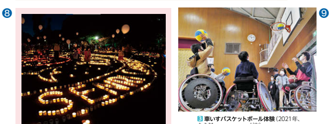
⑧ 千里キャンドルロード (2022年、大阪府吹田市・豊中市) ⑨ 車いすバスケットボール体験 (2021年、和歌山県和歌山市) 東京パラリンピックに出場した選手が、バラスポーツのおもしろさや、挑戦することの大切さを伝える活動を行っています。