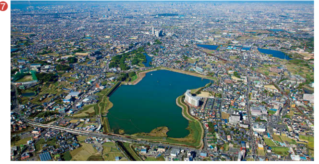
⑦ 狭山池(大阪府大阪狭山市)