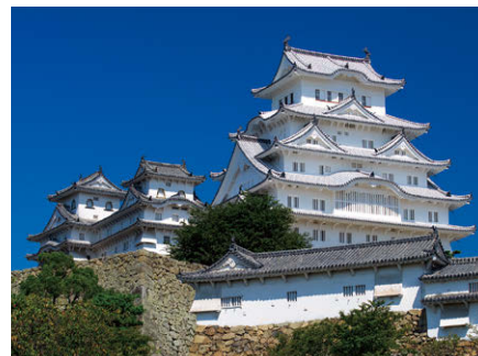
4 姫路城(兵庫県) 国宝 世界遺産