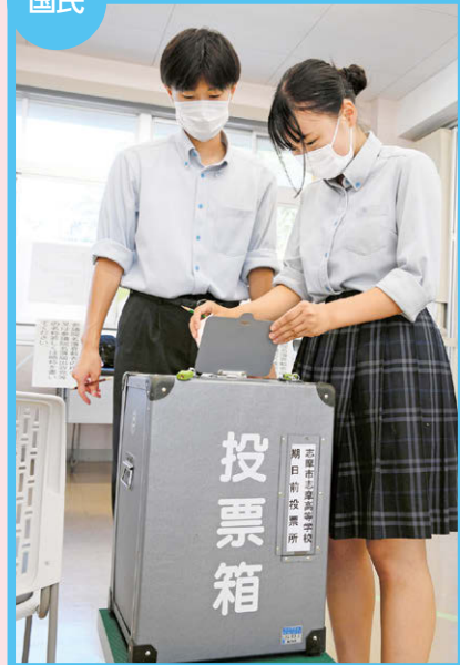
1 国民権 (2022年、三重県志摩市)