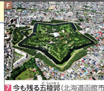
7 今も残る五稜郭(北海道函館市)