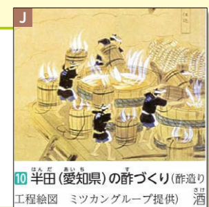
10 半田(愛知県)の酢づくり(酢造り工程絵図 ミツカングループ提供) 酒