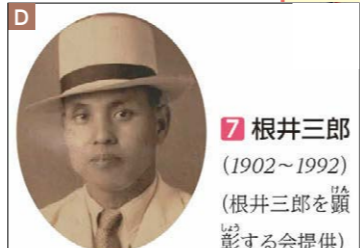
7 根井三郎(1902~1992)