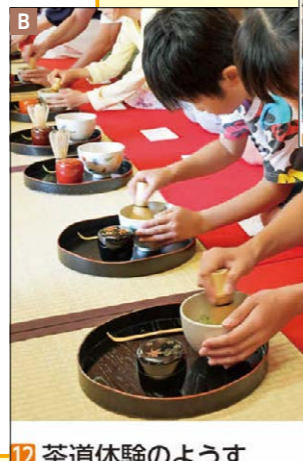
12 茶道体験のようす