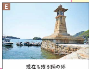
現在も残る灯の塔