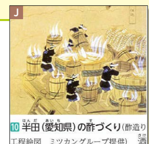
10 半田(愛知県)の酢づくり(酢造り) 工程絵図