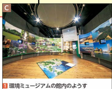
1 環境ミュージアムの館内のようす