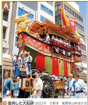
11 復興した大船鉾(2022年、京都府、船鉾山鉾連合会)