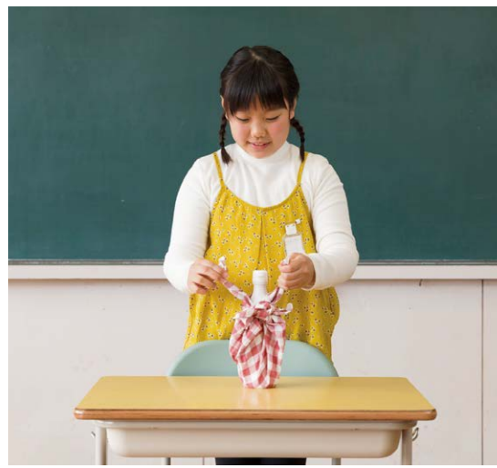
3年 P.50-55 「10 ふろしき」(ぐっと深める)