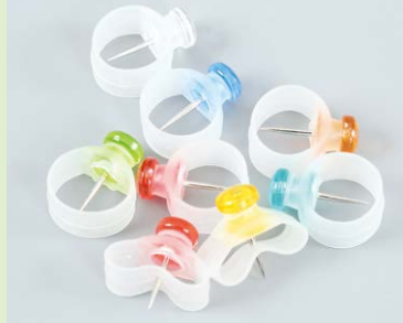
2年 安全な押しピン