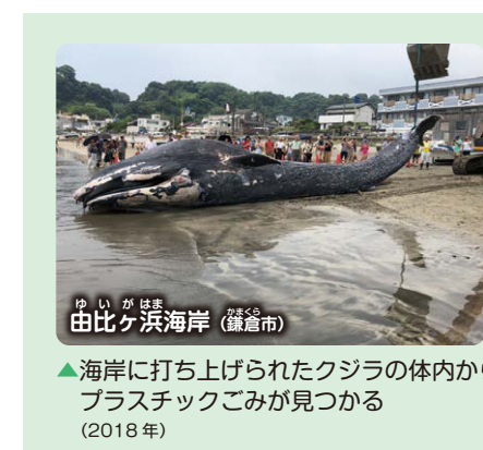
5年 P.36-43 「8 ひとふみ十年」(ぐっと深める)