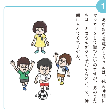
5年 P.158-161 「34 これって不公平？」