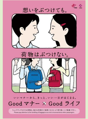
5年 駅のポスターのメッセージ