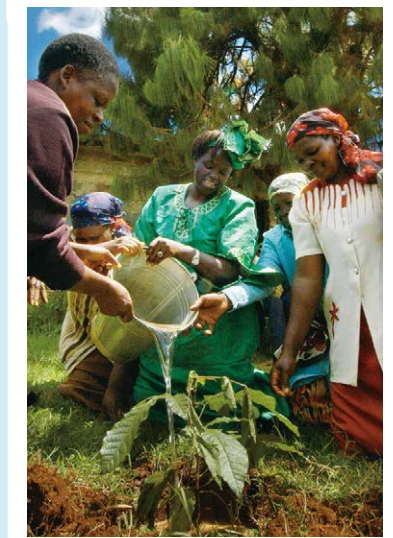
6年 P.32-35 「7 緑の闘士-ワンガリ・マータイ-」