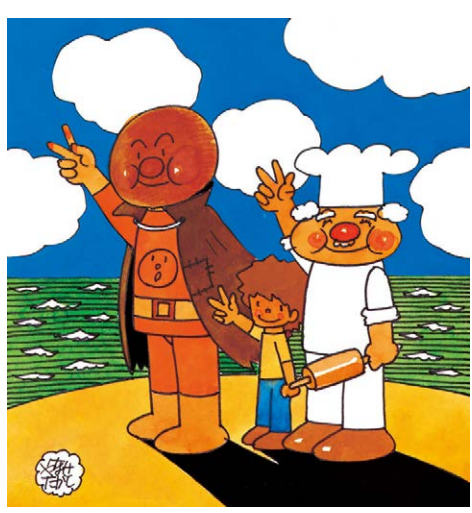
3年 P.128-131 「27 いちばんうれしいこと」