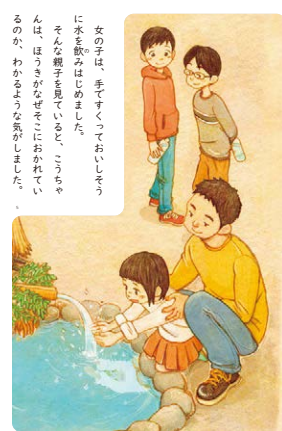
3年 P.108-111 「22 みんなのわき水」