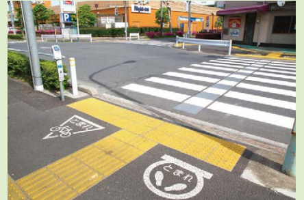
3年 点字ブロックと横断歩道