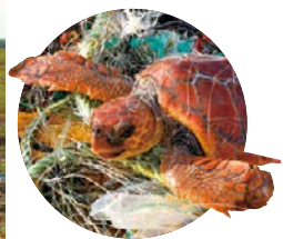
②プラスチックごみによる被害を受けた海の生き物