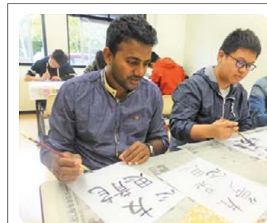
⑥ 書道体験 のようす

我が国や郷土を愛する態度の育成を重視するとともに、他国の文化へ興味をもたせる教材を充実させています。