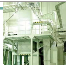
⑤リンを出さずに無洗米をつくる装置(和歌山市)

無洗米は、とがずにそのまま食べるので、多くの家庭で喜ばれています。しかし、無洗米をつくる時は、その過程でリンをふくんだとぎ汁が出ます。リンは、下水処理場でも取りのぞくのがむずかしく、水質汚染につながります。そこで、とぎ汁を出さずに無洗米をつくる装置が開発されています。栄養分とうまみもそのまま残るので、環境だけでなく、健康にもよいと世界からも注目されています。