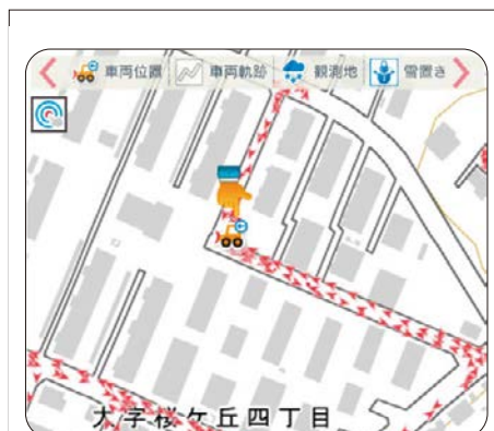
③ ひろさき便利まっぷ 赤い矢印は、車両が除雪した場所をしめします。

Society5.0の実現に向け、多種多様な情報を集め、効果的に活用することができる知識・技能の育成につながる教材を充実させています。