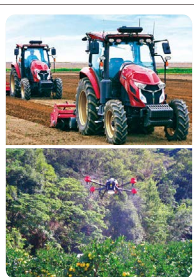
④人が乗る必要のない トラクター (上)と、 ドローン による 薬の散布 (下)