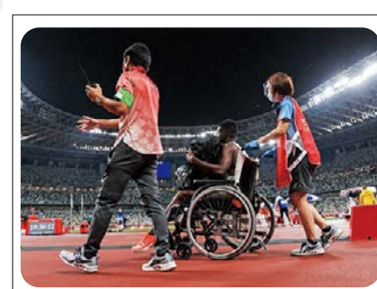
③ 東京2020パラリンピック大会 でのボランティアの活動のようす(2021年、