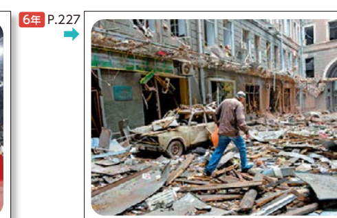
⑥ ロシア軍の攻撃 でこわれた建物の中を歩く人(2022年、ウクライナ)