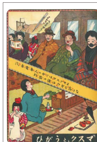
② マスク や うがい を呼びかけるポスター(1920年) スペイン風邪が流行したころ、30000枚が印刷され、全国に配られました。

健康的な生活や、生産・消費活動について興味・関心を高めることができるよう、教材を充実させています。