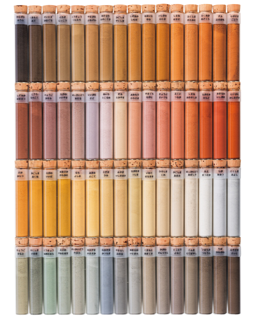
3・4上p.2-4「しぜんの色」より

地域による多様性について色で実感してもらおうと、アーティストの栗田宏一氏に、全国の土を使った『土のライブラリー2018』をこの教科書のために制作していただきました。